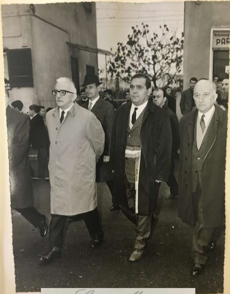
Luigi Mannucci SINDACO DI SAN DONATO MILANESE