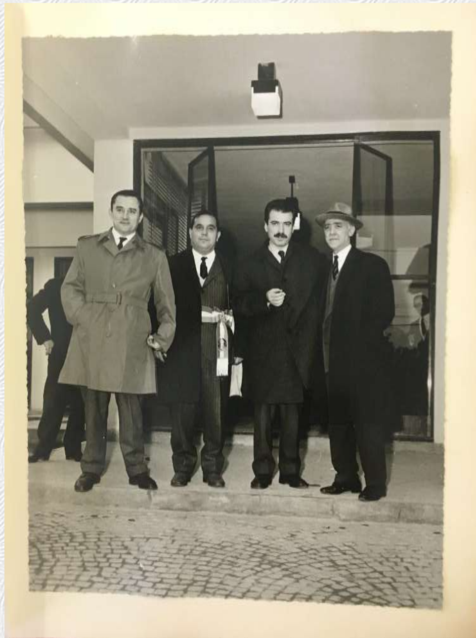
A cura di Roberta Pelati